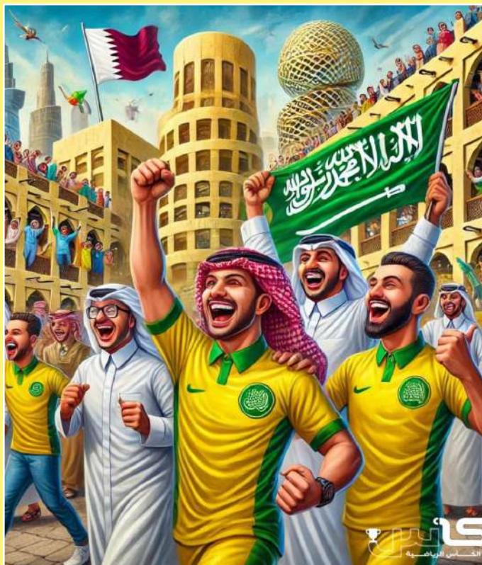
كاريكاتير - هيثم حسين