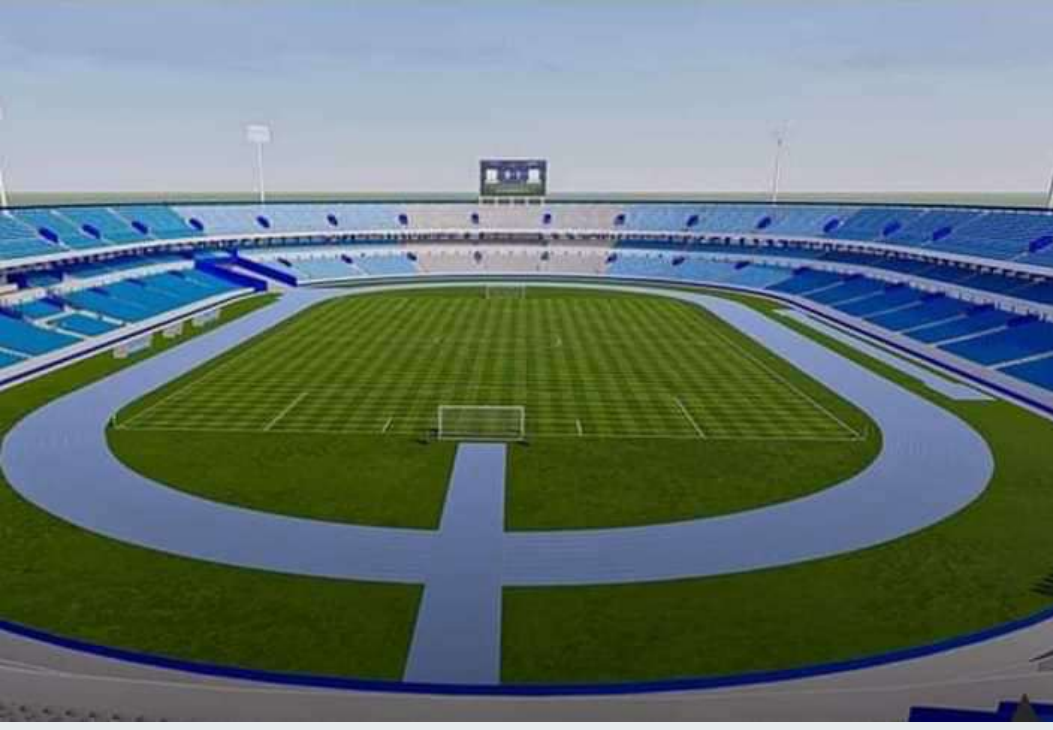
ملعب طرابلس الدولي