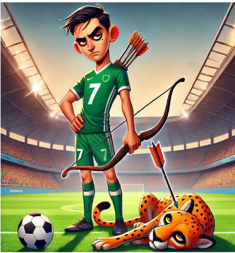
كاريكاتير - هيثم حسين

في الشوط الثاني، حاول الأهلي تعزيز تقدمه وأضاع أكثر من فرصة، فيما أجرى مدرب الفيحاء عدة تبديلات لتعديل النتيجة، لكن مهاجمي الفريق لم يتمكنوا من الوصول إلى مرمى الأهلي. وفي النهاية، أعلن حكم اللقاء فوز الأهلي ووصوله إلى النقطة 17، فيما بقي الفيحاء على نقاطه السبع.