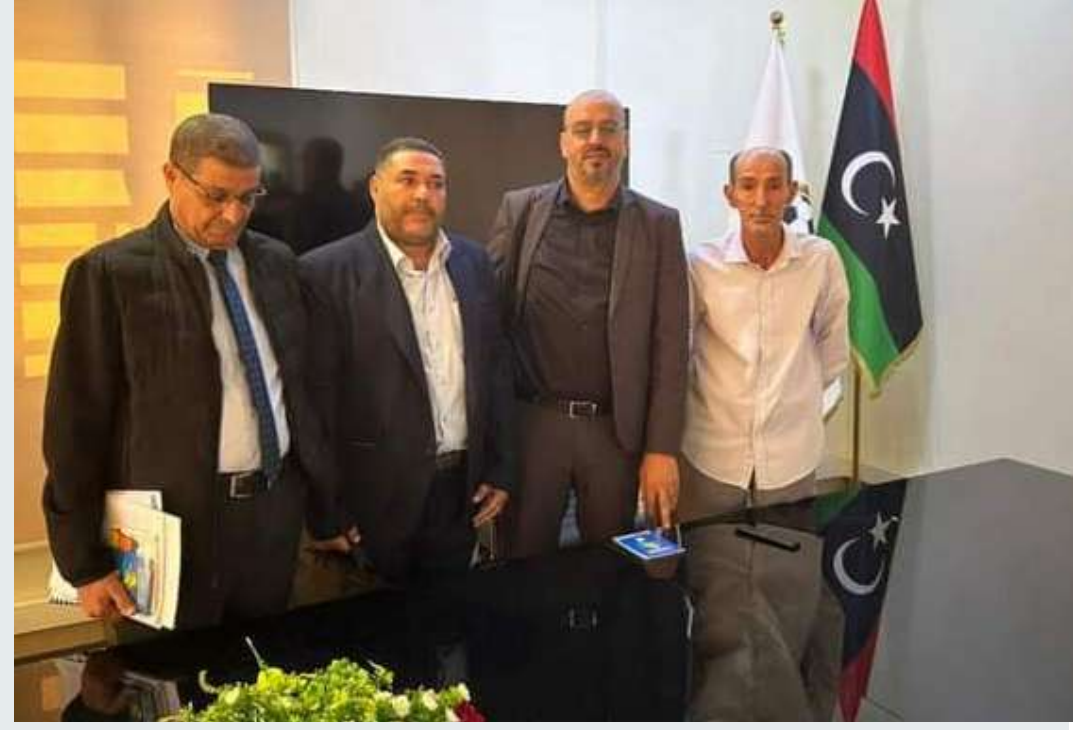
القائم بأعمال رئيس الاتحاد الليبي لكرة القدم مع أعضاء اللجنة الانتخابية المقبلة