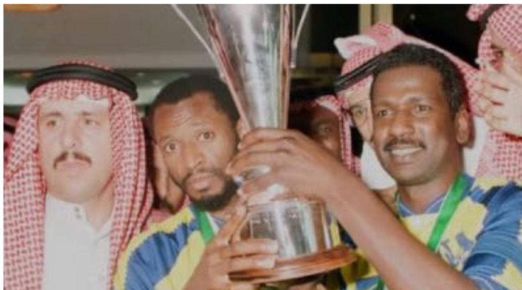
الأسطورة ماجد عبدالله حين يتكلم الذهب بلغة الأهداف