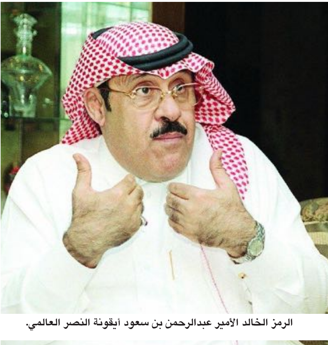
الرمز الخالد الأمير عبدالرحمن بن سعود أيقونة النصر العالمي.

منذ ذلك الحين، والنصر يعيش في قلبي، أتابعه بشغف، أفرح بانتصاراته، وأفتخر بتاريخه. النصر العالمي، الذي تأسس عام 1955، ظل صرحًا شامخًا في سماء الكرة